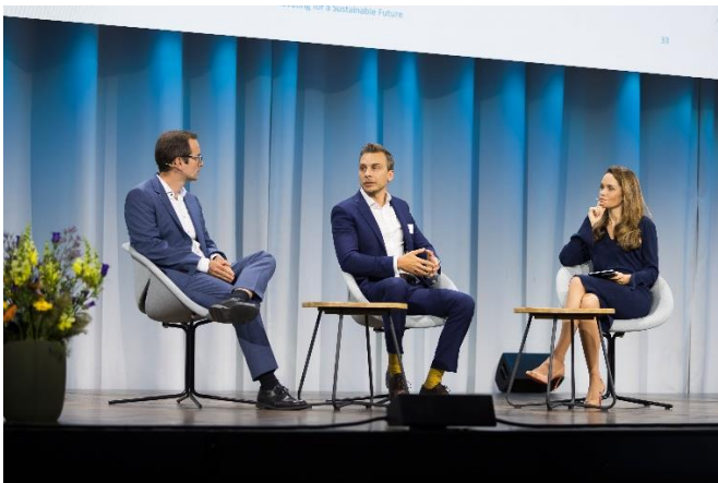
SSF Conférence Annuelle - 18 juin 2026 – 2