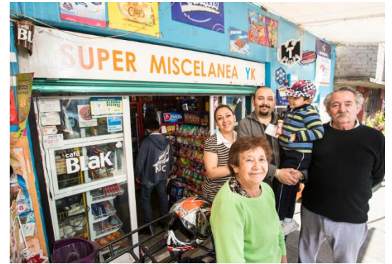
Familie Morales Konfio-Kunde betreibt Minimarkt in Mexico City